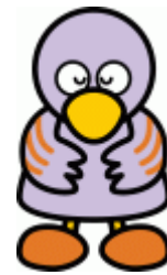
【埼玉県マスコット・コバトン】